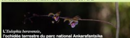
L' Eulophia beravensis , l'orchidée terrestre du parc national Ankarafantsika

Ce sera également une occasion pour découvrir sur pied les bois précieux comme le bois d'ébènes, les plantes tinctoriales, les plantes médicinales ou encore les fruits pleins de curiosité qui constituent l'alimentation des animaux du Parc.