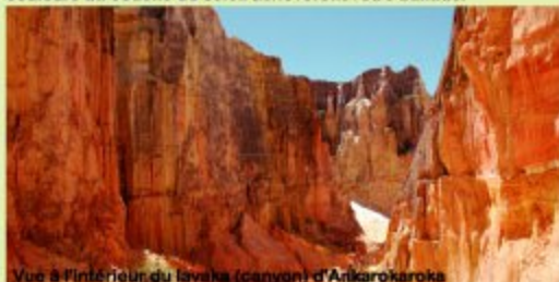
Vue à l'intérieur du lavaika (canyon) d'Ankarokaroka

Exposée sur le flanc ouest du parc, la fraîcheur, les lumières et les couleurs du couché du soleil achèveront votre ballade.