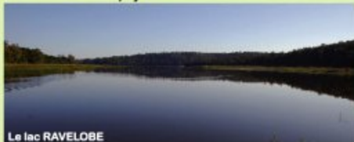
Le lac RAVELOBE

Le lac RAVELOBE, étendu sur plus de 20 Ha, mis en valeur par ses trois tours d'observation ornithologique et une embarcation conçue pour l'observation, vous fera vivre la magie des plans d'eau, doublée par la beauté de la forêt rupicole qui l'entoure, les magnifiques paysages raphièrés ou de l'impressionnante population d'oiseaux d'eau qui y vit.