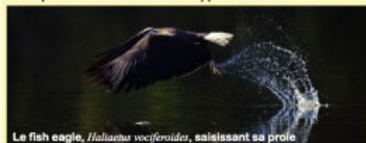
Le fish eagle, Haliaeetus vociferoides , saisissant sa proie

Avec 130 espèces d'oiseaux, dont 66 endémiques de Madagascar, le Parc National Ankarafantsika attire les ornithologues du monde entier pour des espèces comme le Vanga de Van dam ( Xenopirostris damii ), la Mésite variée ( Mesitornis variiegata ) ou l'Asity ( Phallegitta schlegelii ). Pour les moins initiés, la facilité d'observation, la beauté et les comportements spectaculaires de ces animaux procureront des expériences et des émotions supplémentaires.